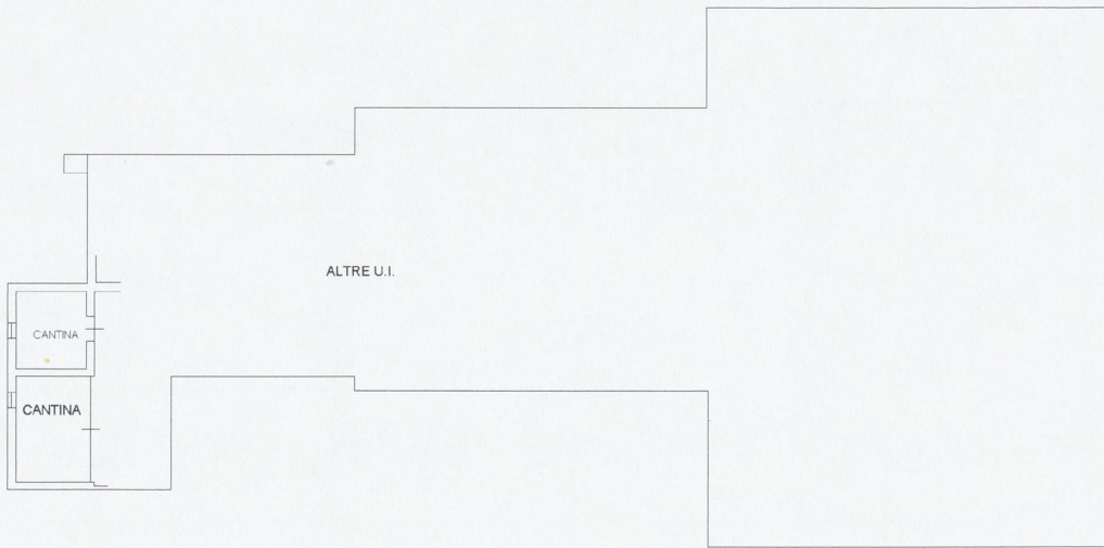
PIANO TERRA H=2.76 m